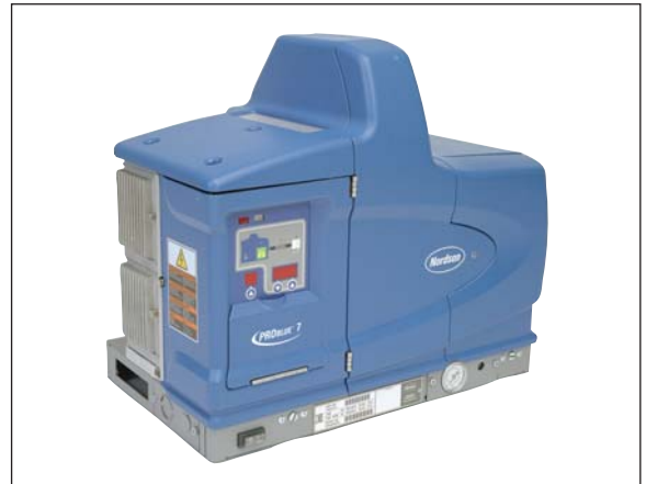
Applicatore per adesivi termofusibili ProBlue®