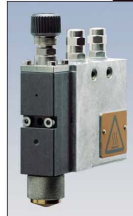
Pistola EP 34 S

Per ulteriori informazioni, potrete rivolgerVi al nostro funzionario tecnico-commerciale, oppure metterVi in contatto con la sede Nordson a Voi più vicina.