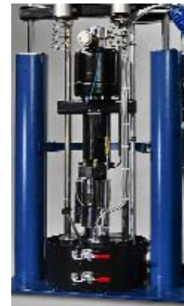
Pompa a pistone – la soluzione per adesivi a viscosità elevata.