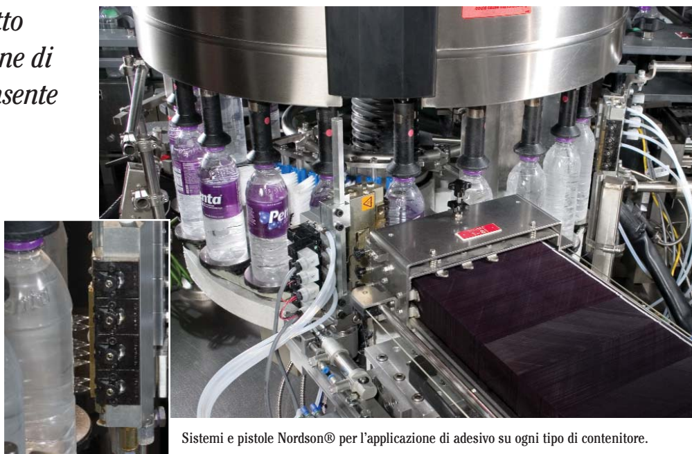
Sistemi e pistole Nordson® per l'applicazione di adesivo su ogni tipo di contenitore.

Sistema compatto per l'applicazione di adesivo che consente di migliorare le operazioni di etichettatura.